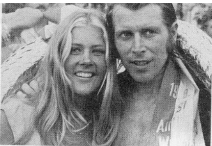
Roger Decoster, opnieuw wereldkampioen na een van de mooiste G.P. races van dit seizoen.